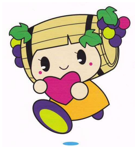
塩尻市社協キャラクター「しおりん」