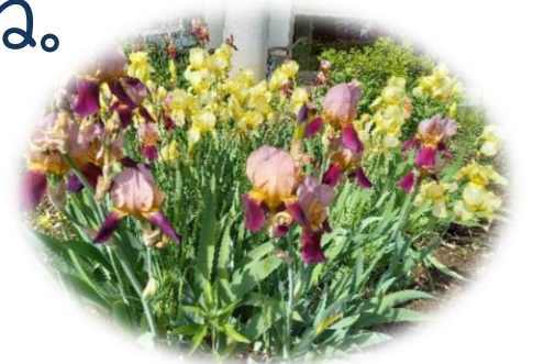
すがのの郷で咲いたジャーマンアイリス

真夏のような暑い日が続いたと思えば、遅霜になりそうな日があるなど、気温の変化が目まぐるしい時季ですね。大きな寒暖差は体調不良の要因になりやすく注意が必要です。カーディガン等の上着で体温調節できるように工夫しましょう。