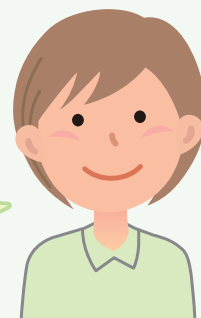
地域包括支援 センター職員