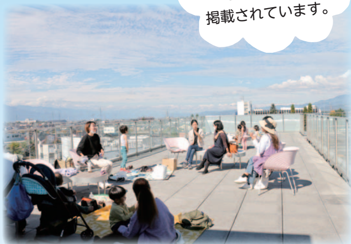
▲ソトイク・プロジェクト 天気の良い日には、屋上で活動を行います。