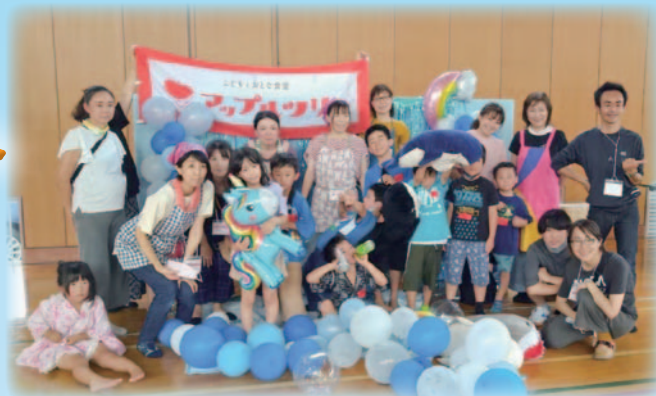
▲アップルツリー夏祭りの様子