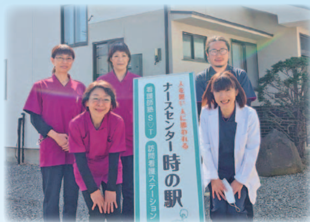
▲ナースセンター「時の駅」スタッフの皆さん