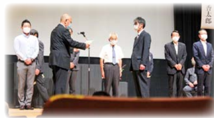
▲塩尻市社会福祉大会での表彰