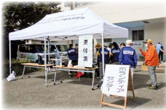
▲災害ボランティアセンター立ち上げ運営訓練の様子