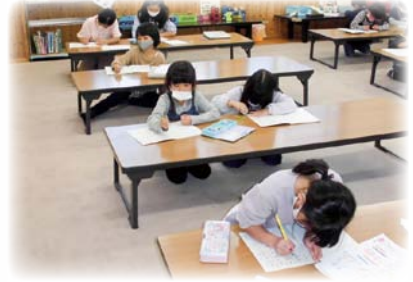
洗馬児童クラブの様子▶