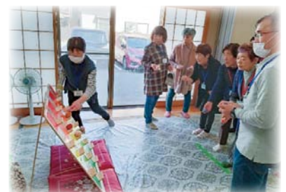
地域の中で、住民同士が集い交流を深めつながっていく温かな活動に…。