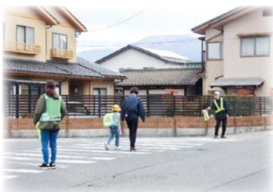
各地域で、子どもから高齢者まで幅広く行われている見守り活動に…。