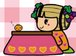
塩尻市社協キャラクター しおりん