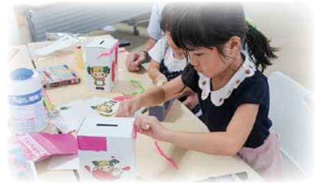
▲ワークショップでの様子

皆様からお寄せいただいた赤い羽根共同募金は、支部・分会の活動や子育てサロンの運営、貸出福祉自動車の管理、地域の災害の備えや災害準備金等、地域の身近な福祉活動に使われます。