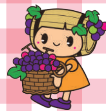
塩尻市社協キャラクター しおりん