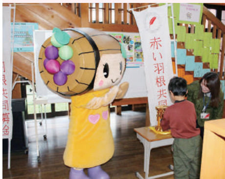
榎川小中学校 募金活動の様子