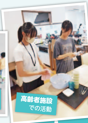
高齢者施設 での活動