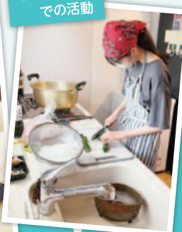
子ども食堂 での活動