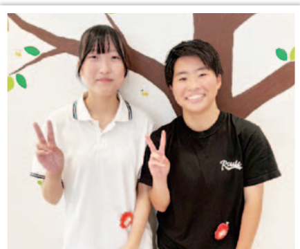
信州リハビリテーション 専門学校1年生