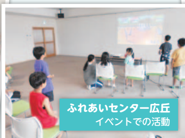
ふれあいセンター-広丘 イベントでの活動