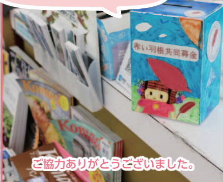
ご協力ありがとうございました。

赤い羽根共同募金活動期間中、 地域福祉活動を応援するために、 塩尻市内の店舗に募金箱を 設置していただきました。